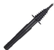
Sonda ostrzowa czarna 1 kV (gniazdo do bananowe)