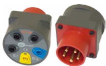
Adapter AGT-16P (adapter gniazd trójfazowych)