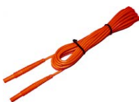
Przewód 5 m czerwony 1 kV (wtyki bananowe)