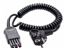
Adapter WS-04 (wtyk kątowy UNI-Schuko)