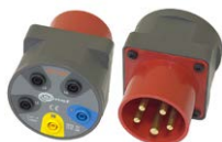
Adapter AGT-32P (adapter gniazd trójfazowych)