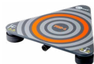
Sonda do pomiaru rezystancji podłóg i ścian PRS-1