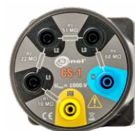
Symulator kabla CS-1