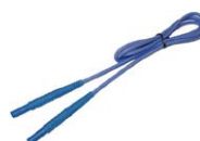
Przewód 1,2 m niebieski 1 kV (wtyki bananowe)